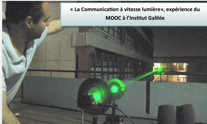
« La Communication à vitesse lumière », expérience du MOOC à l'Institut Galilée

Les inscriptions sont ouvertes sur France Université