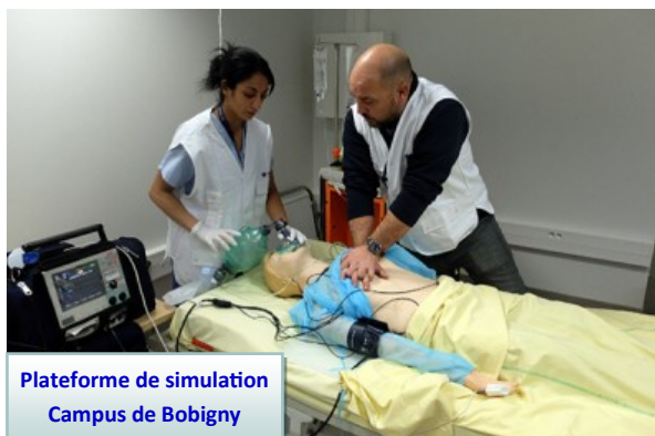
Plateforme de simulation Campus de Bobigny

-Exemple : si je suis inscrit en PASS option droit, je pourrais poursuivre en 2 e année de la licence de droit.