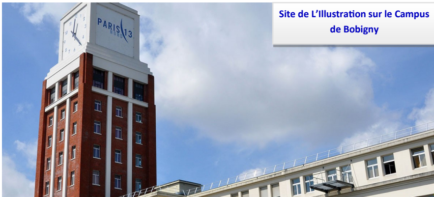
Site de L'illustration sur le Campus de Bobigny

Une inscription en PASS décompte obligatoirement une première chance d'entrer dans les études de santé.